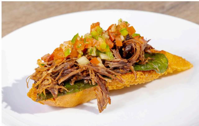
Pepito Guíxols (carn de vedella amb maionesa de la casa i pico de gallo)