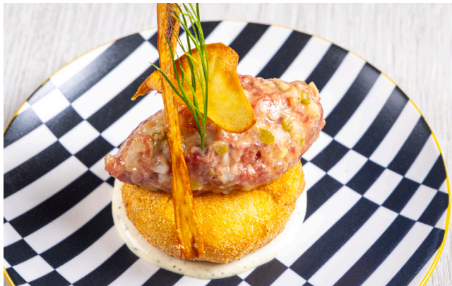
Bola de iuca amb formatge i steak tàrtar