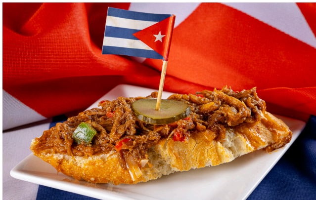
Montadito de ropa vieja